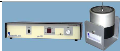
Системы вибровозбуждения LW 139.151-30

Программное обеспечение разработано в среде NI LabVIEW с использованием пакета Sound and Vibration ToolKit.