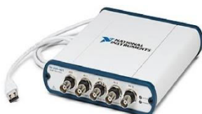
NI USB-4431 – виброизмерительный модуль